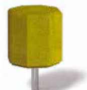
mit Bodenanker Art.-Nr. 2565000109

Das Terrasoft Polygon findet seinen Einsatz in zahlreichen Gebieten: ob als Begrenzungselement für Einfahrten und Wege oder als Sitzgelegenheit zum Beispiel an Sandkästen. Unterschiedliche Farben regen hierbei phantasievolles Spielen der Kinder an.